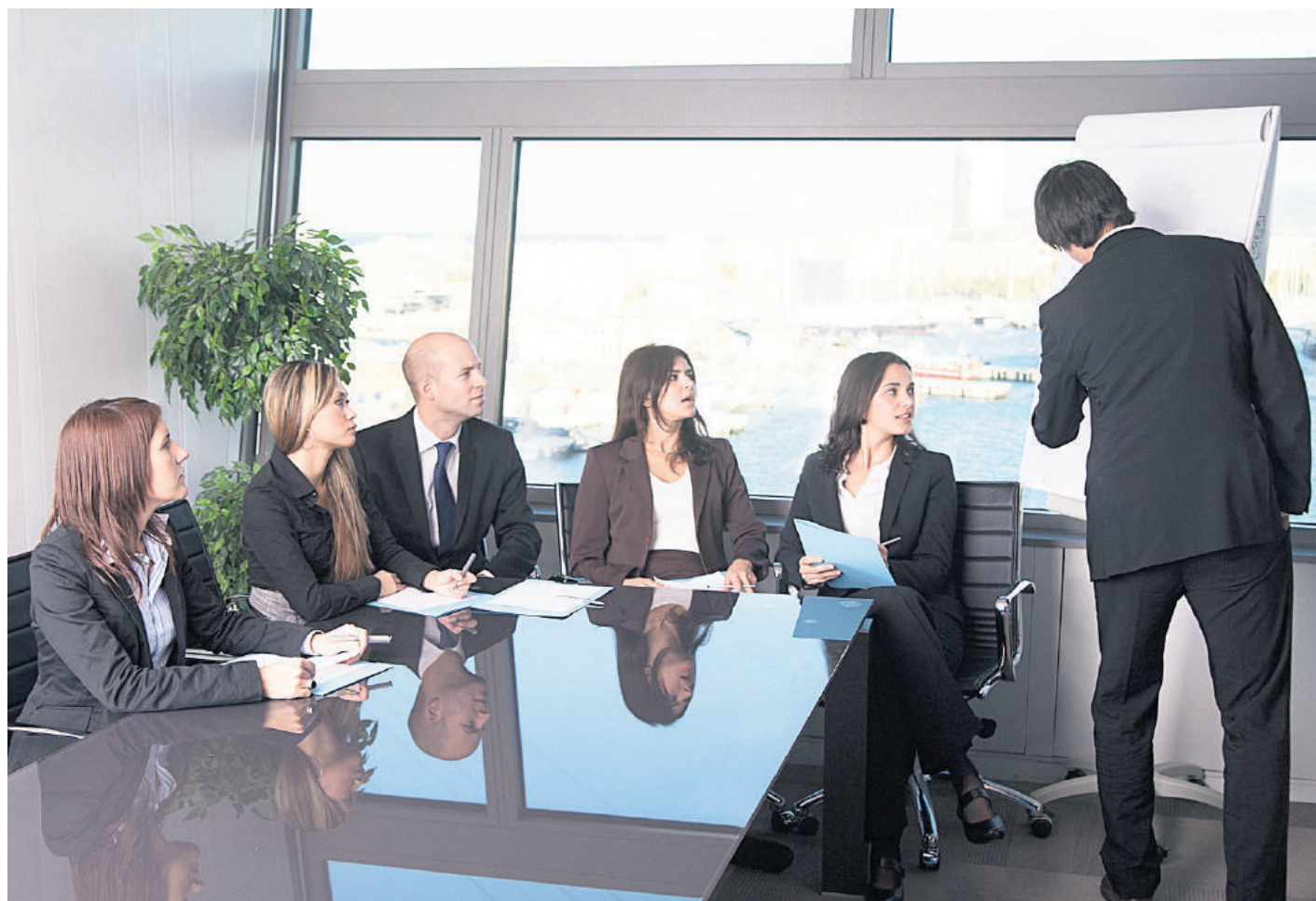
Les salariés qui détiennent une expertise très recherchée n'ont aucune difficulté pour décrocher des contrats

Le recrutement d'un consultant déjà salarié n'a rien à voir avec l'embauche d'un candidat à temps plein. «On ne peut lui demander, par exemple, son curriculum vitae pour une prestation de service qui va durer deux ou trois jours. Un consultant est d'abord un intervenant qui possède une solide notoriété sur le marché», ajoute Lghali. La carte de visite d'un consultant est donc son meilleur faire-valoir pour dénicher les contrats. Il n'est pas concevable qu'il fasse de la prospection pour décrocher un job en parallèle avec ses activités de salarié. Les cabinets disposent tous d'une base de données des intervenants qu'ils enrichis-