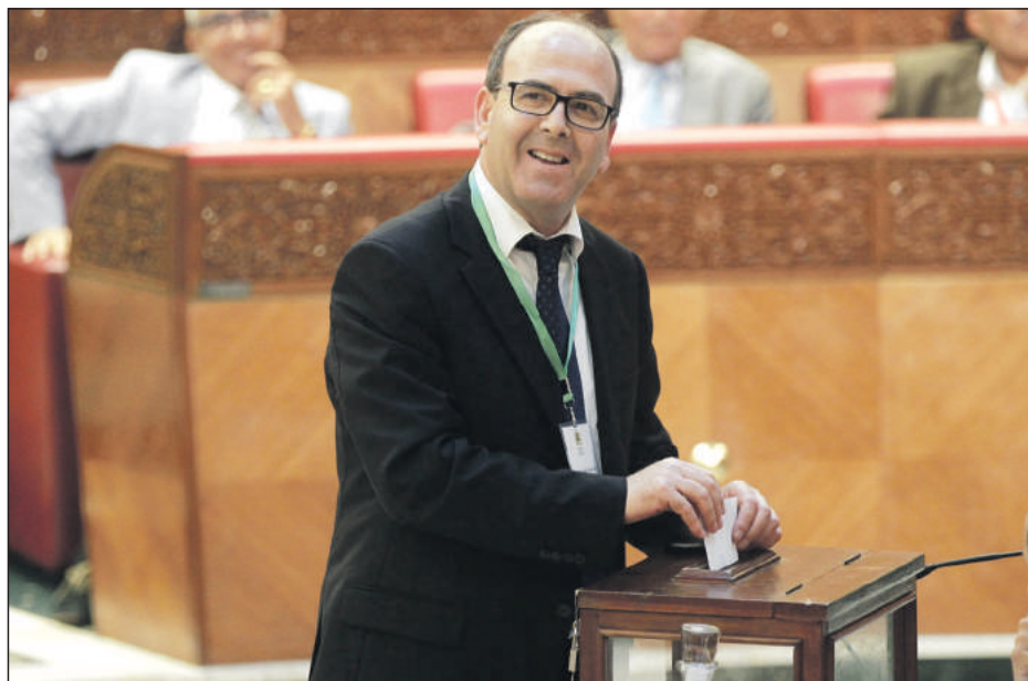
L'élection de la Chambre des conseillers a éclaboussé l'institution législative et réduit de l'attrait de la pratique politique chez une grande partie de la jeunesse et de l'opinion publique

Les deux présidents du Parlement touchent une indemnité forfaitaire men-