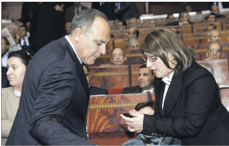
Depuis la distribution des téléphones portables aux députés, la facture des communications a connu une baisse de 4 à 1,5 million de DH

C'EST une véritable prouesse: même avec une flotte de 395 téléphones portables pour les députés et autres dizaines destinés aux fonctionnaires de la Chambre des représentants, ajoutés à 15 heures par mois de communications gratuites, la facture est passée au régime. Cette chambre paie une facture de 1,6 million de DH contre 4 millions de DH auparavant, sans ces téléphones portables. C'est l'option prise par le président de la Chambre des représentants qui veut supprimer de la rubrique dépenses à partir de 2016 les montants des SMS envoyés aux députés (800.000 DH). L'autre action de la présidence a consisté dans la distribution gratuite, aux 395 députés, de tablettes. L'engouement des parlementaires est manifeste. D'ailleurs, ces tablettes vont également servir, via une ap-