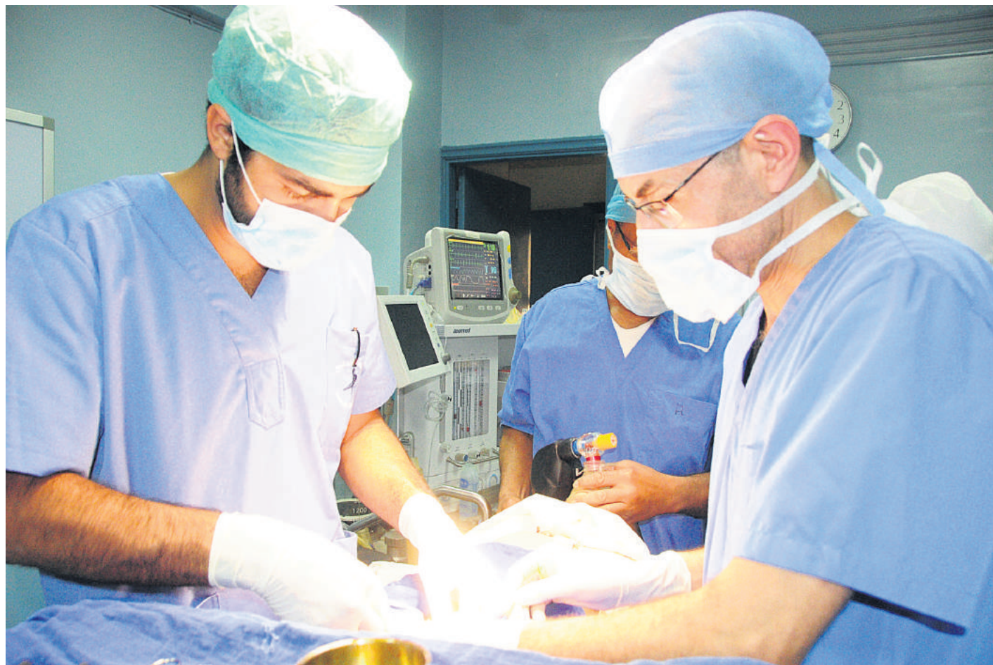
La majorité des cadres bénéficie d'une assurance maladie privée. Le plafond par assuré et par an varie entre un minimum de 2.500 dirhams et un maximum de 3 millions de dirhams

Le palier de cotisation aux contrats maladie gérés par les compagnies d'as-