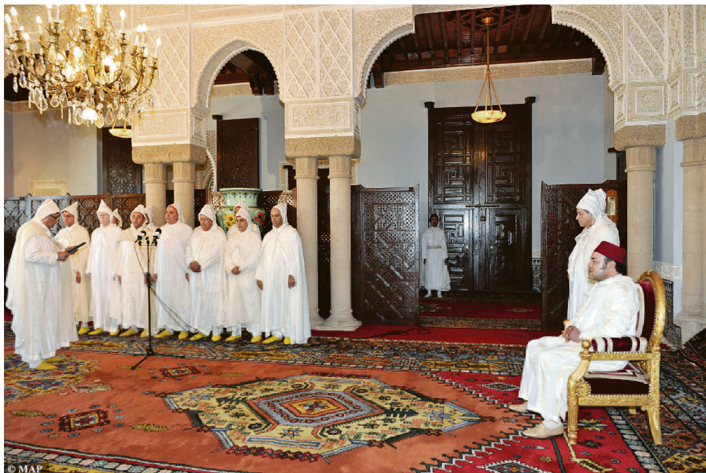
Au-delà des avantages greffés à la fonction, le statut conféré par la responsabilité est un puissant facteur de motivation des prétendants au poste de wali et de gouverneur

Ce texte devrait instituer, pour un wali, une indemnité forfaitaire mensuelle de logement de 32.260 dirhams, 26.460 pour un gouverneur, 15.000 dirhams au super pacha (chef de cercle), 12.740 DH au pacha. Le super caïd aurait prétendu à 9.190 DH, le premier adjoint du caïd, 2.850 et le second adjoint, 2.170 dirhams.