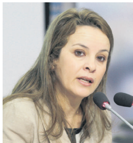
Le buzz autour des pensions de retraite des ministres et des parlementaires a été déclenché par les propos provocants tenus par Charafat Afilal lors d'une émission télévisée

la retraite des ministres, instaurée par feu Hassan II qui aurait constaté qu'un de ses anciens ministres n'avait aucun revenu pour subvenir à ses besoins. Depuis, ce système est en vigueur. Lors des premiers mois de son mandat, le chef du gouvernement, Abdelilah Benkirane