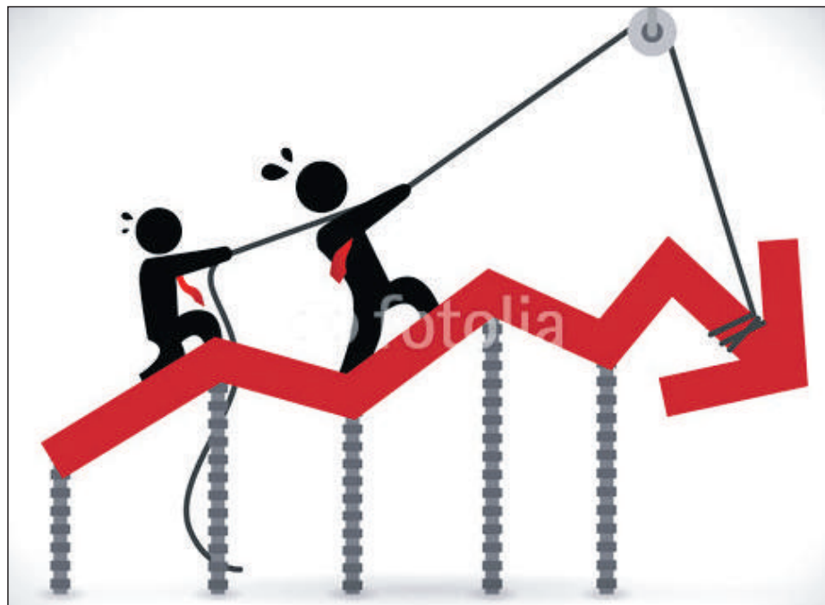
En période de crise, le recouvrement devient l'affaire de tous. Dirigeants et cadres se mobilisent pour ramener du cash, car il en va de la survie de l'entreprise

Dans les TPME, ce sont surtout les patrons qui se retroussent les manches pour aller à la recherche du cash bloqué chez les clients. «Ces dernières années, les profils assurant cette fonction ont gagné en qualification. Ce sont de plus en plus des lauréats de bac+4 ou 5 qui touchent entre 20.000 et 25.000 DH par mois», soutient le président de l'AMCR. En effet, pour aller à la rencontre des clients, comprendre les procédures et législations, assurer un